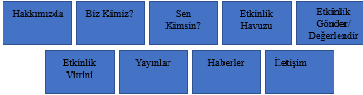
Şekil 1. Web sitesinin konu başlıkları

“Yaşam Boyu Kütüphane”, kullanıcılarına sunduğu içerikleri ve hizmetleri şu konu başlıkları 3 altında toplamaktadır (Şekil 1):