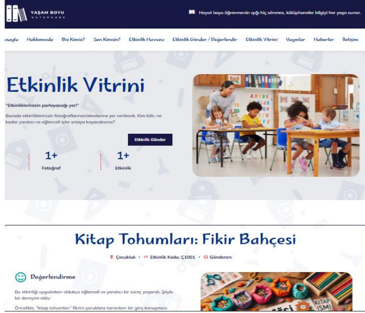
Şekil 5. Web sitesinin "Etkinlik Vitrini" bölümünden bir kesit

"Etkinlik Vitrini" bölümünde (Şekil 5), sitedeki etkinlikleri deneyimleyen kullanıcıların katkıları, önerileri, varsa ekledikleri uygulama fotoğrafları/görselleri sergilenmektedir. Kullanıcılar birbirlerinin deneyimlerine, önerilerine, katkılarına ya da eleştirilerine tanıklık etmekte ve dinamizmi sürekli devam eden, kendi içinde güncellenen etkinlik ve uygulamalara kolayca ulaşabilmektedir. Etkinlik vitrininin bu yönüyle, kullanıcıların çeşitli fırsatlar keşfetmesini sağlamak gibi bir amacı da bulunmaktadır.