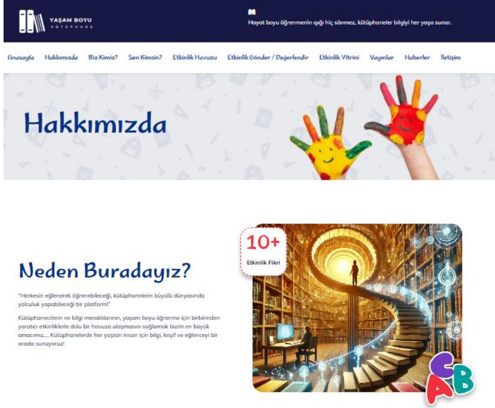
Şekil 2. Web sitesinin "Hakkımızda" bölümünden bir kesit

" Biz Kimiz? " bölümünde, Yaşam Boyu Kütüphane platformunun, bilgiye erişimi kolaylaştırmayı ve yaşam boyu öğrenmeyi teşvik etmeyi hedefleyen bir ekip tarafından oluşturulduğu belirtilmektedir. Kütüphaneciler, bilgi profesyonelleri ve öğrencilerden oluşan bir grubun, bu platformu her yaşta kullanıcıya yönelik etkinliklerle zenginleştirerek, sürekli öğrenmeyi desteklemeyi amaçladığı aktarılmaya çalışılmaktadır.