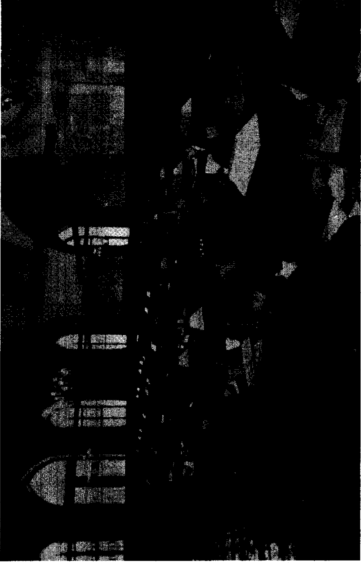
Bayezit Umumi Kütüphanesinin yeniden tanzim edilen 186 kişilik Okuma Salonu