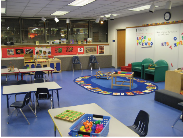
(Resim 3): Okulöncesi çocuklar keşif merkezi

Referans masası, çocuk bölümünün çok merkezi bir yerine yerleştirilmiştir. Bölüme giren herkesin görebileceği çok kritik bir noktada yer alan bu masada bulunan görevliler her an okuyucuya yardım etmektedirler. Böylece okuyucular kendilerini daha rahat hissetmektedirler.