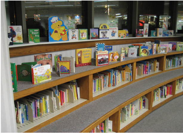
(Resim 1): Kitap rafları

Yeterli materyali bulundurmak kadar o materyallerin sunumu da önemlidir. Bu bağlamda, MİHK'nin çok başarılı bir sunum yaptığını söylemek mümkündür, çünkü raflarda bulunan materyaller düzgün ve her an erişime hazır konumdadır. İkinci olarak, yaş gruplarına göre hazırlanmış raf boyları da ayrıca okuyucular için bir çekim kaynağıdır. Örneğin, 2-3 yaş çocukları istedikleri kitapları boyları hizasında bulunan raflardan çekip alabilmekte ve yine kendi boyları için hazırlanan masa ve sandalyelerde bu kitapları kendilerine göre okuyabilmekte.