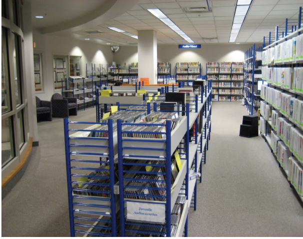
(Resim 2): Kitapdışı materyal rafları

Özetle, gerek materyal adedi, gerekse materyal çeşitliliği bakımından MİHK çocuk bölümü oldukça zengin durumdadır.