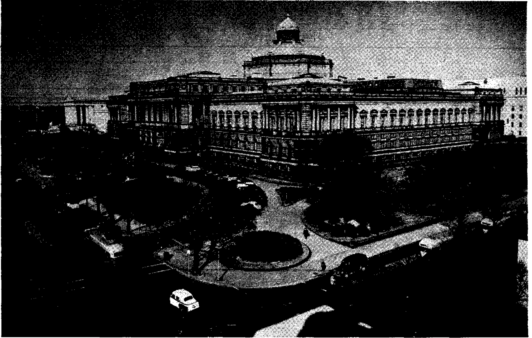
Congress Library'nin esas binası (Arkada sağda ek binanın bir kısmı görülüyor)